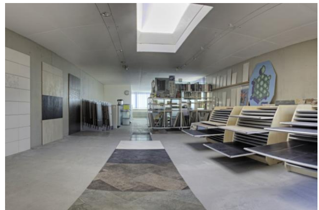
Vor dem Umbau der Ausstellung

Um den Boden neu zu gestalten werden Platten im Grossformat eingesetzt, welche dem Raum einen neuen Glanz verpassen. Ausserdem bringt das neue Projekt mit sich, dass so neue Ordnung geschaffen wird.